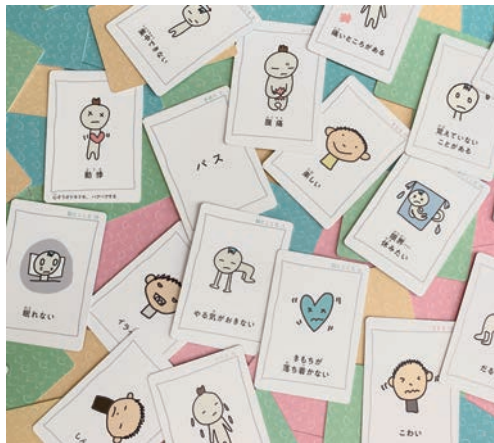
『こころとからだ コンディションカード』(合同出版)