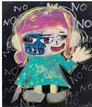
『No だけど笑っちゃうことあるんだよな』