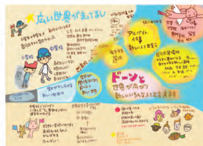
『生きる冒険地図(学苑社)より』