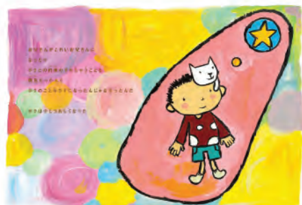
『ボクのこと わすれちゃったの?—お父さんはアルコール依存症—(ゆまに書房)より』