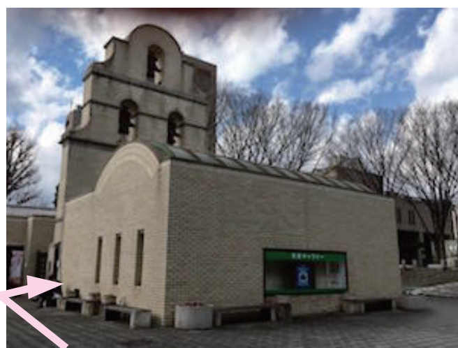
近づくとこんなかんじ ギャラリーの入り口はぐるっと反対側へ