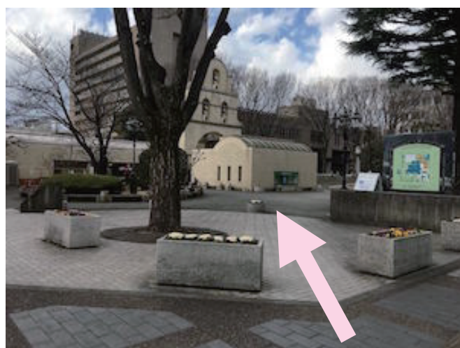
交差点から市役所の敷地へ入るところ 矢印の先の「丸い屋根の小さな建物」